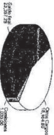
GRAFICO CUENTA DE CHEQUES